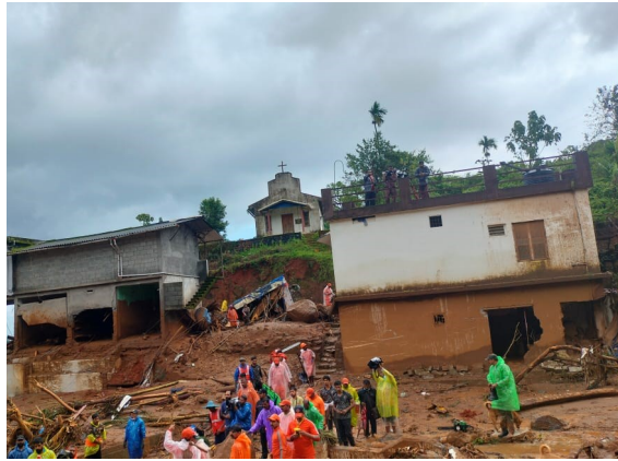
die Kirche in Mundakai blieb erhalten

gen, die Wayanads Berge und Hügel wie ein grüner Ornamentteppich überziehen. Nun wurde ausgerechnet vielen der Ärmsten ihr Zuhause weggespült. Aber auch Schulen und Häuser, die fest gebaut waren, sind der Katastrophe zum Opfer gefallen.