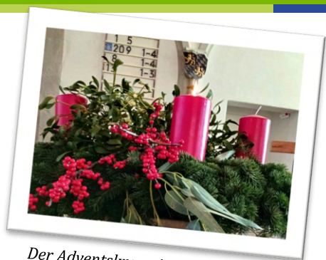
Der Adventskranz in der Stiftskirche im letzten Jahr.