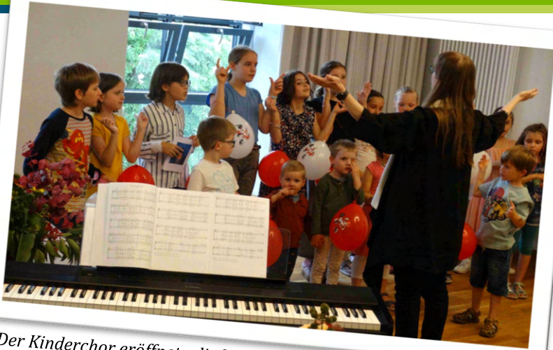
Der Kinderchor eröffnete die heitere, aber auch nachdenkliche Feier.